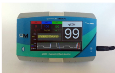
qCON 2000™ mit übersichtlichem Farbdisplay.

Das qCON 2000™ nimmt über drei kostengünstige EEG-Elektroden an der Stirn des Patienten das EEG auf. Die gewonnenen Frequenzinhalte des EEG werden innerhalb weniger Sekunden zu dem qCON umgerechnet.